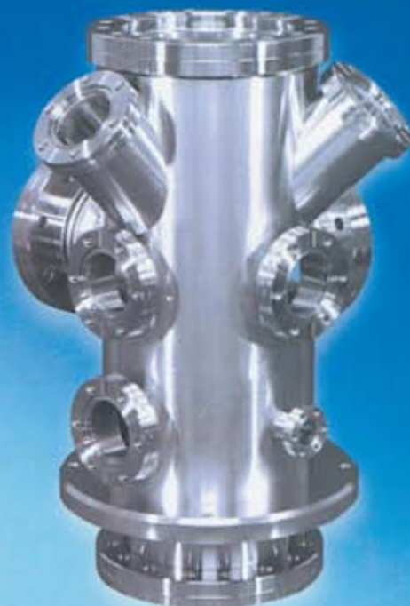
材質 SUS304 真空チャンバー