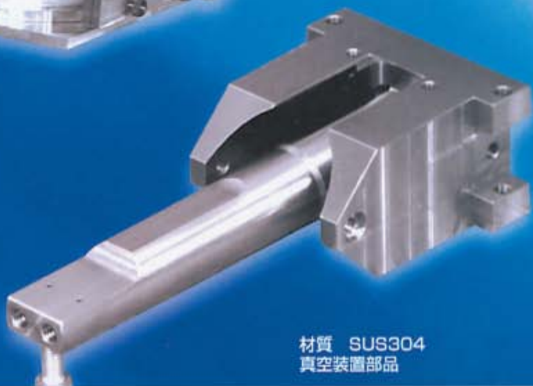
材質 SUS304 真空装置部品