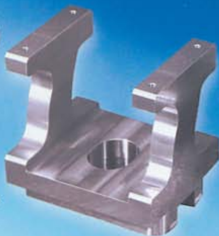
材質 SUS316 真空装置部品