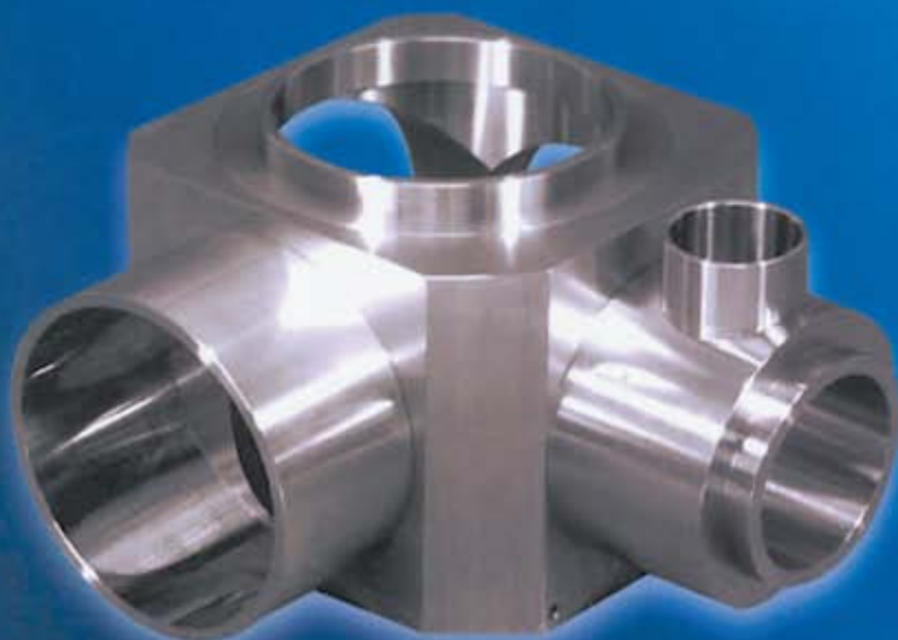
材質 SUS304 真空チャンバー