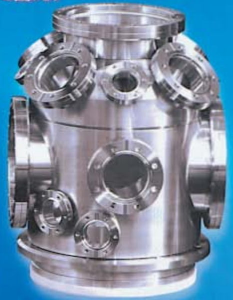
材質 SUS304 真空チャンバー

私たちは常にたゆまぬ努力を積み重ね、成果を経験として蓄え、 さまざまな分野から知識を吸収し、未来を見つめ、 新しい発見から創造へと変革を続けます。 お客様に信頼される企業であること、 それが東和工業株式会社の理念です。